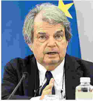
Renato Brunetta, ministro per la Funzione Pubblica