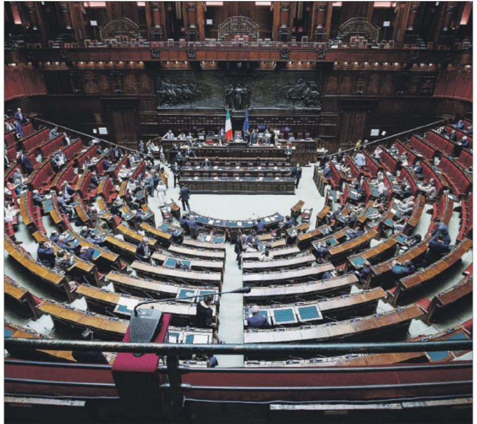
"Se il prossimo governo, di qualunque colore esso sia, saprà raccogliere l'eredità di quello uscente, avrà l'appoggio dei mercati". Nella foto LaPresse, la Camera dei deputati

Su Pnrr, riforma del Patto di stabilità e dei trattati bisognerebbe costruire un grande Patto repubblicano