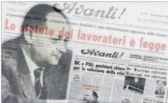
Un fotomontaggio con il profilo di Brodolini e le pagine dell'Avanti con le notizie della sua malattia e dell'approvazione dello Statuto

La collaborazione, la coesione sociale, la partecipazione, l'inclusione, la parità di genere possono e debbono diventare catalizzatori di efficienza, di crescita e di giustizia sociale: il mercato da solo non basta più. Questa è la lezione dei nostri straordinari riformisti che, da oltre quaranta anni, è per me motivo di ispirazione.